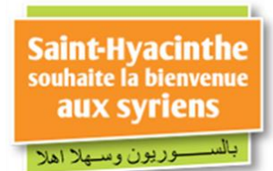
Page Web sur le site www.mfm.qc.ca