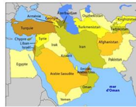
Document d'information sur la Syrie et la situation des réfugiés