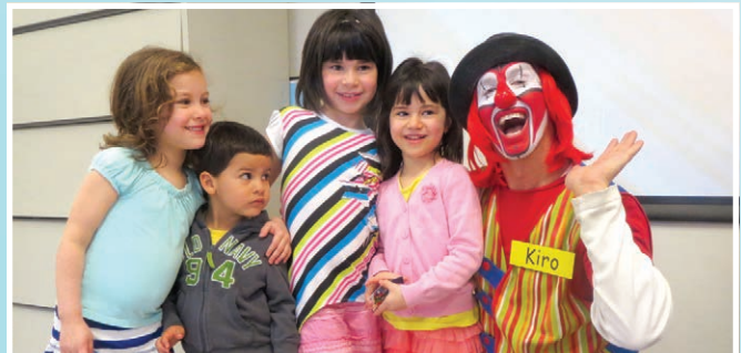
Journée portes ouvertes de la Maison de la Famille