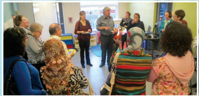
Cocktail en l'honneur de nos bénévoles