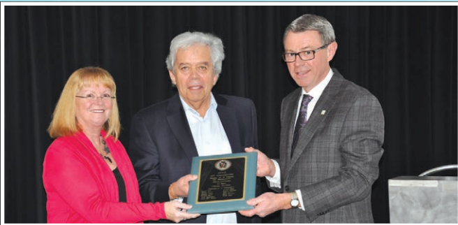
Cocktail du 20 e anniversaire de la Maison de la Famille