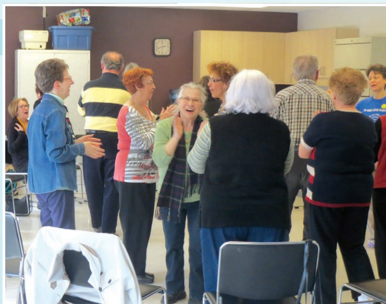
Conférence-atelier sur le « Yoga du rire »