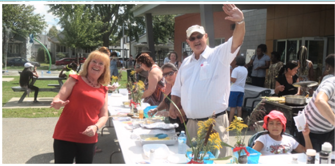
Épluchette « Aux saveurs du monde »