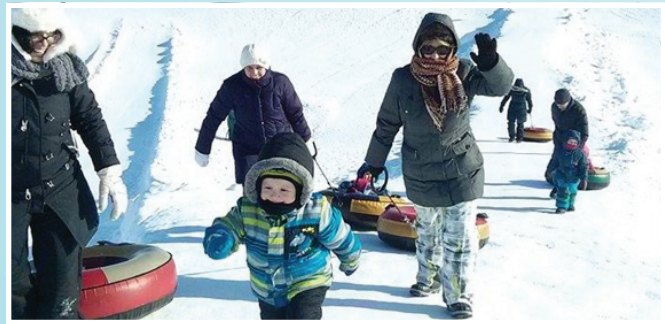
Sortie au parc Les Salines