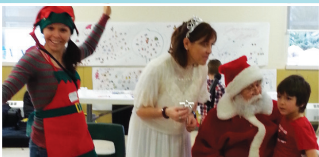
Fête de Noël pour les enfants