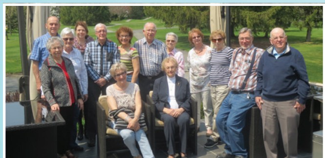
Dîner programme adultes et proches aidants